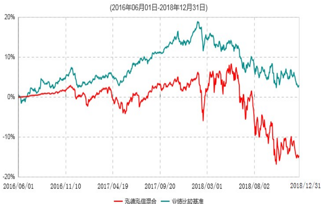
泓德泓信灵活配置混合型证券投资基金累计净值增长率与业绩比较基准收益率历史走势对比图

注：根据基金合同的约定，本基金建仓期为6个月，截至报告期末，本基金的各项投资比例符合基金合同关于投资范围及投资限制规定。