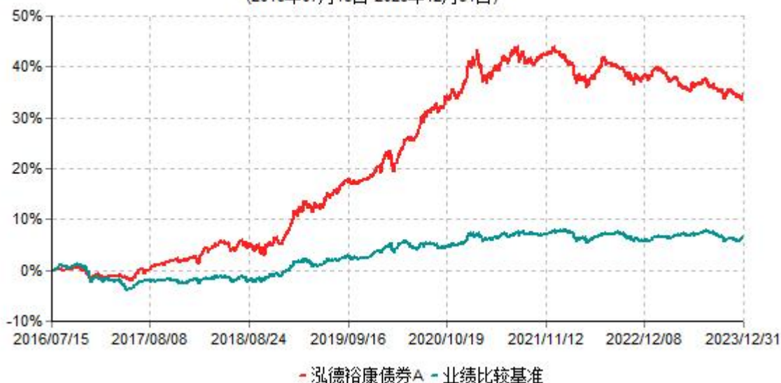
泓德裕康债券A累计净值增长率与业绩比较基准收益率历史走势对比图 (2016年07月15日-2023年12月31日)