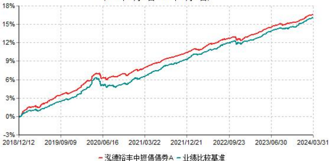
泓德裕丰中短债债券A累计净值增长率与业绩比较基准收益率历史走势对比图 (2018年12月12日-2024年03月31日)