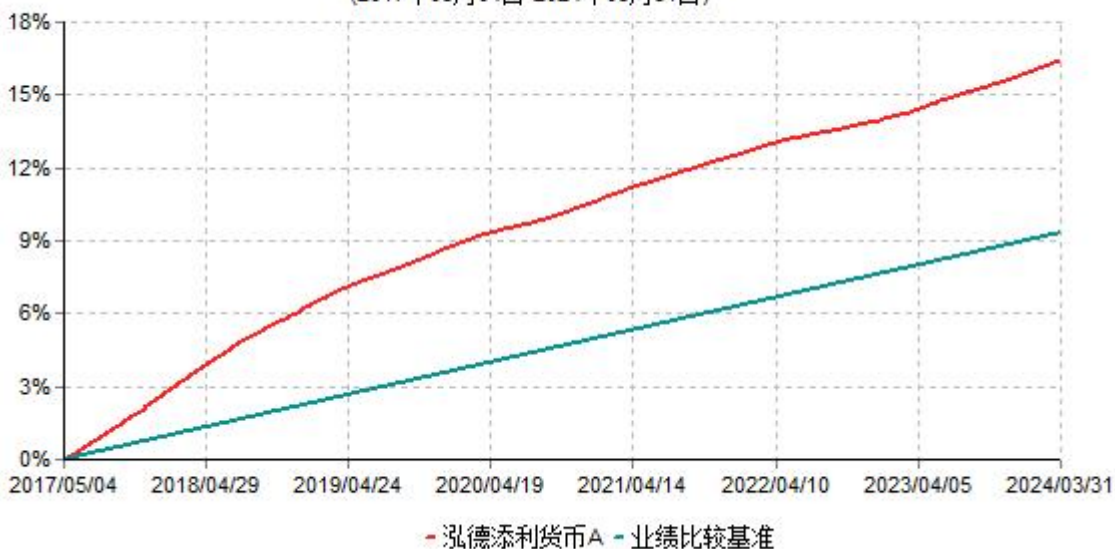
泓德添利货币A累计净值收益率与业绩比较基准收益率历史走势对比图 (2017年05月04日-2024年03月31日)