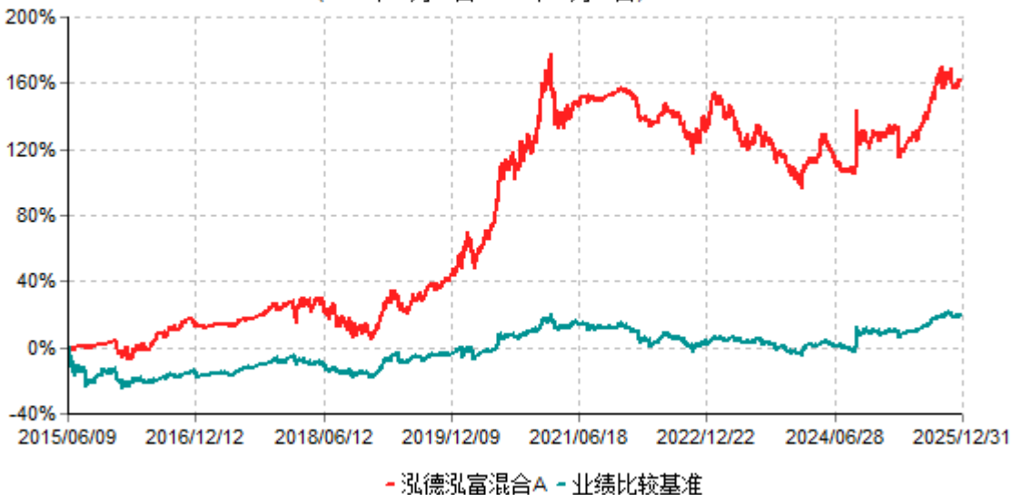
泓德泓富混合A累计净值增长率与业绩比较基准收益率历史走势对比图 (2015年06月09日-2025年12月31日)