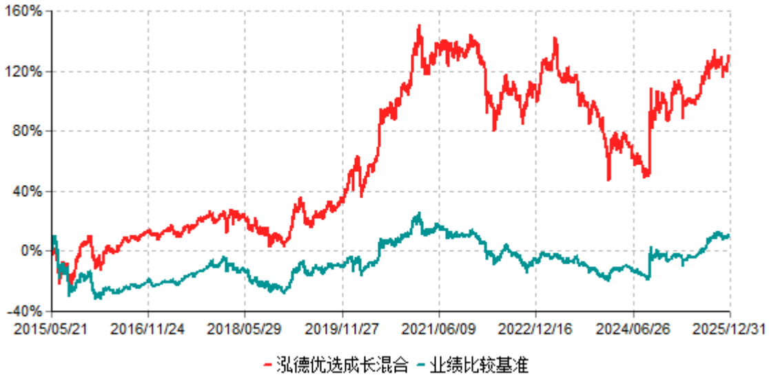
泓德优选成长混合累计净值增长率与业绩比较基准收益率历史走势对比图 (2015年05月21日-2025年12月31日)

注：根据基金合同的约定，本基金建仓期为6个月，截至报告期末，本基金的各项投资比例符合基金合同关于投资范围及投资限制规定。