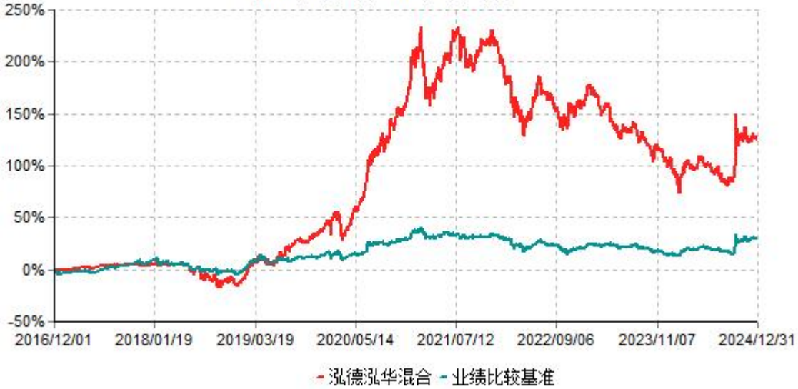
泓德泓华混合累计净值增长率与业绩比较基准收益率历史走势对比图 (2016年12月01日-2024年12月31日)

注：根据基金合同的约定，本基金建仓期为6个月，截至报告期末，本基金的各项投资比例符合基金合同关于投资范围及投资限制规定。