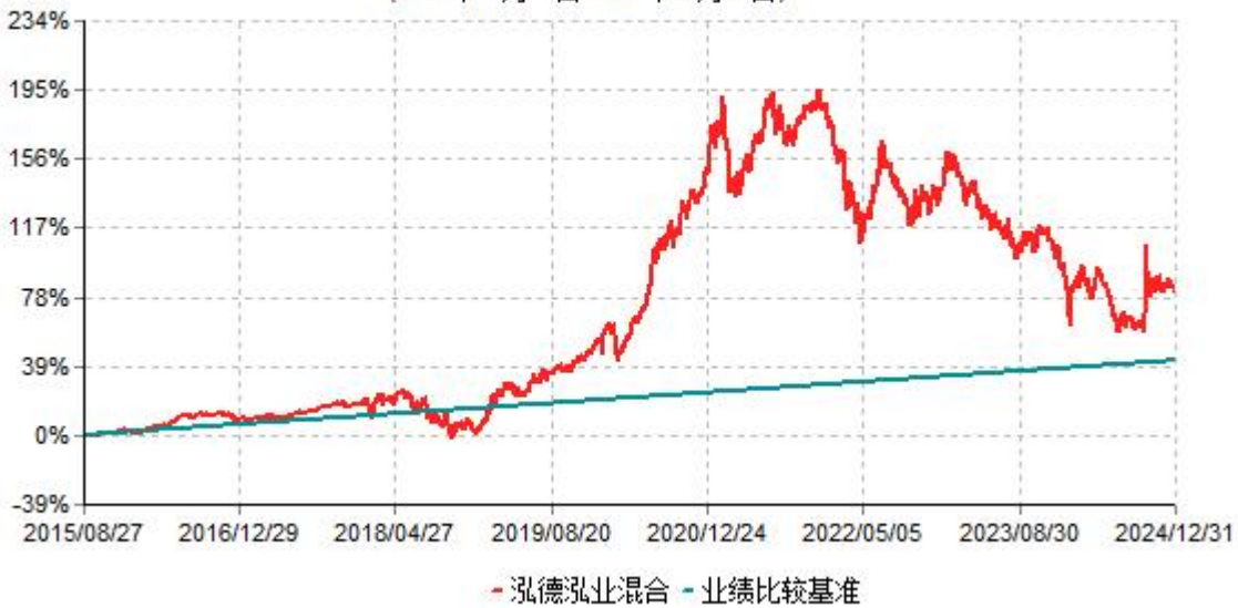
泓德泓业混合累计净值增长率与业绩比较基准收益率历史走势对比图 (2015年08月27日-2024年12月31日)

注：根据基金合同的约定，本基金建仓期为6个月，截至报告期末，本基金的各项投资比例符合基金合同关于投资范围及投资限制规定。