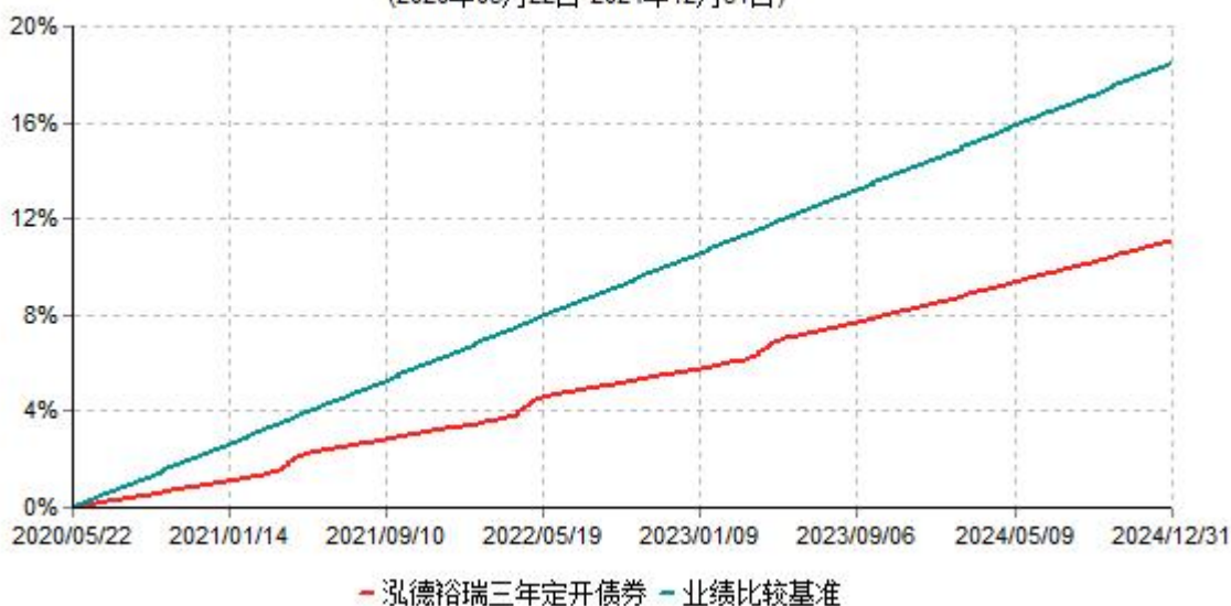
泓德裕瑞三年定开债券累计净值增长率与业绩比较基准收益率历史走势对比图 (2020年05月22日-2024年12月31日)

注：根据基金合同的约定，本基金建仓期为6个月，截至报告期末，本基金的各项投资比例符合基金合同关于投资范围及投资限制规定。