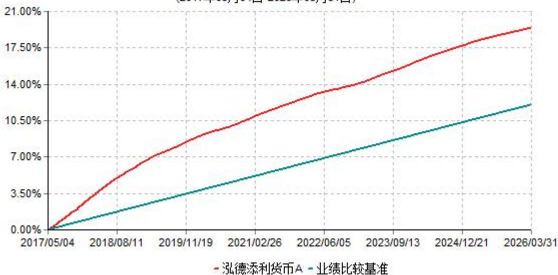
泓德添利货币A累计净值收益率与业绩比较基准收益率历史走势对比图 (2017年05月04日-2026年03月31日)